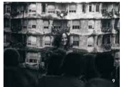
4. Casa Batlló.

Una altra qüestió important va ser decidir la imatge gràfica de l'exposició. Es va escollir un fragment de l'obra que Ramon Casas va presentar per al «Concurs de cartells de la Casa Codorniu»: una dona que mira alegrement l'espectador amb una copa, tot convidant-lo a brindar i a participar, amb la utilització d'un grafisme modern que es va fer servir per a tot tipus de propaganda (pòsters, postals, fulletons, banderoles, bosses, etc.). En canvi, per als punts de llibre gratuïts, es va emprar un detall