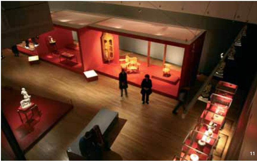
10. Els Güell i la ciutat de les fàbriques.