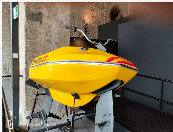
Embarcació esportiva Museu Marítim de Barcelona.

El Museu de la Vall d'Aran, en la seua coneguda com El Musèu de la Vall d'Aran, tracta l'esquí, atesa la importància de la seua pràctica a la Vall d'Aran, que gairebé esdevé un signe d'identitat. La seua central, a Vielha, més tímidament incorpora elements presentistes, com l'evolució de l'aranès i la transformació del paisatge.