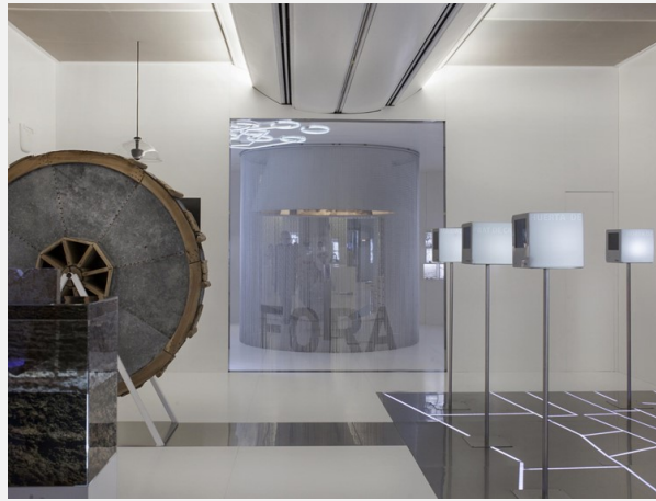
Sales permanents del museu.

Pel que fa a les mancances, cal fer referència per una part a les tasques de catalogació i accessibilitat de la col·lecció. Hi ha encara molta feina per fer al respecte en la tasca de catalogació d'una part important de la col·lecció, així com de fer accessible eixe coneixement al públic interessat. Hi ha igualment la necessitat de resoldre l'atenció deficitària que el museu ha prestat històricament al camp de l'etnografia del món mariner valencià. Les sales permanents que obren el 2022 no mostren aquest àmbit crucial per entendre el País Valencià de hui.