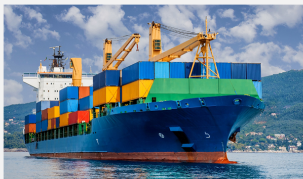
Marina-mercant. Museu Marítim.

El Museu Marítim mostra altra vegada un compromís elevat amb la cultura contemporània, perquè té una línia específica de recollida de materials de preservació del patrimoni marítim de la segona meitat del segle XX. El canvi econòmic accelera el desús dels objectes, accelerant el procés de patrimonialització (Pomian, 1987). També recull fons documentals i fotogràfics d'empreses del sector marítim.