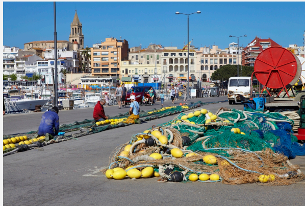
Moll pesquer. Museu de la Pesca.

A banda de les modalitats de tractament del present, tipus pròleg, epíleg o com a sales convencionals del museu, hi ha un altre tractament que consisteix a donar pinzellades de contemporaneïtat. Així, el Museu Etnològic i de les Cultures del Món, a la seu de Montjuïc, incorpora les sensibilitats culturals actuals.