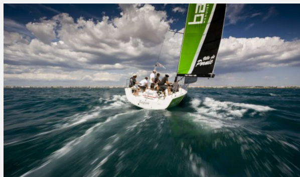
Projecte-esports-nautica. Museu Marítim de

Com en altres aspectes, el Museu Marítim és el que es mostra més sòlid en recerca, perquè té una considerable estructura de recerca: revista Drassana i Observatori d'Història Marítima, amb la UB. Té una línia específica en història de la cultura i en patrimoni marítim. I té projectes concrets, com el de La Companyia Transatlàntica Espanyola , La pesca i els pescadors a Barcelona , Esport de mar a Catalunya o Veus del mar .