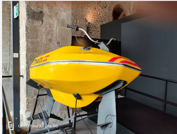
Embarcació esportiva Museu Marítim de Barcelona.

El Museu de la Vall d'Aran, en la seua coneguda com El Musèu de la Vall d'Aran, tracta l'esquí, atesa la importància de la seua pràctica a la Vall d'Aran, que gairebé esdevé un signe d'identitat. La seua central, a Vielha, més tímidament incorpora elements presentistes, com l'evolució de l'aranès i la transformació del paisatge.