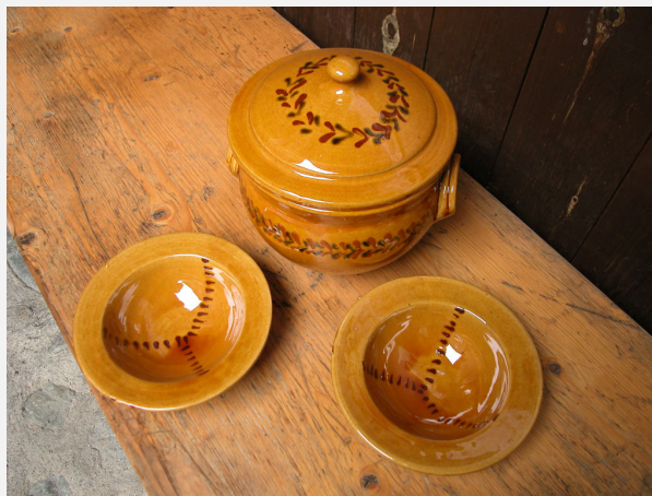
Ceramica. Ecomuseu de les Valls d'Àneu.

La resta de museus incorporen els altres patrimonis que hem esmentat al començament de l'apartat. El Museu de la Pesca recull patrimoni immaterial i patrimoni viu de la pesca. El Museu Etnològic del Montseny ha incorporat al seu fons tota la documentació fotogràfica de les activitats municipals, des de l'inici de la democràcia: 15.208 imatges. L'Ecomuseu de les Valls d'Àneu ha acumulat elements gràfics, molt especialment aquells que documenten l'oposició a la introducció de l'os al Pirineu, documentació gràfica de tancament d'indústries i també elements gràfics sobre l'arribada del turisme i els processos socials i econòmics que ha provocat.