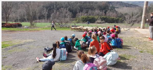
Itinerari Museu Etnològic del Montseny.

El Museu Etnològic del Montseny ha fet exposicions sobre ensenyar i aprendre en un món rural, Lliures sense por (Institut Català de la Dona) i Montseny i cuina . També conferències amb perspectiva de gènere i tallers de memòria. Ha treballat amb alumnes amb alt risc d'exclusió, a través del programa Argonautes, per a centres d'alta complexitat de l'Agència Catalana de Patrimoni Cultural. El museu també és la seu d'activitats de col·lectius locals diversos.