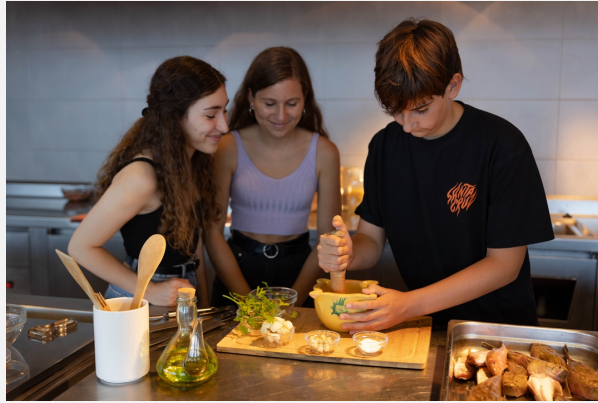
Espai del Peix. Museu de la Pesca.

El Museu de la Pesca de Palamós, en canvi, ho fa mitjançant un audiovisual pròleg, que parla del significat del peix, el consum, la gastronomia i les arts de pesca actuals i passades. L'audiovisual obre les portes al museu.