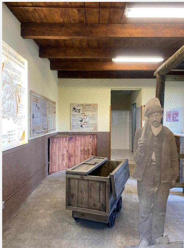
Mina, personificació miner classe obrera. Museu Dera Val d'Aran.

El Vinseum ha incorporat materials de la segona meitat del segle XX, a més de cent màquines de tecnologia obsoleta de l'INCAVI (Institut Català del Vi). Sense oblidar l'art contemporani (Joseph Beuys).