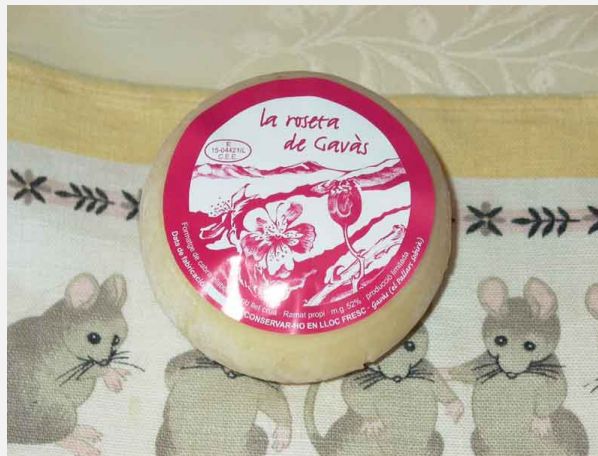
Formatgeria d'Unarre. Ecomuseu de les Valls d'Àneu.