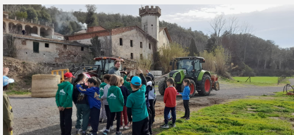
Itinerari del Museu Etnològic del Montseny (1)