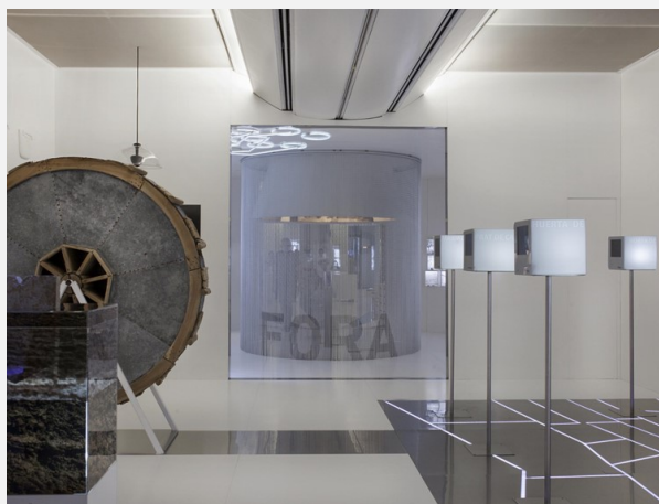
Sales permanents del museu.

Pel que fa a les mancances, cal fer referència per una part a les tasques de catalogació i accessibilitat de la col·lecció. Hi ha encara molta feina per fer al respecte en la tasca de catalogació d'una part important de la col·lecció, així com de fer accessible eixe coneixement al públic interessat. Hi ha igualment la necessitat de resoldre l'atenció deficitària que el museu ha prestat històricament al camp de l'etnografia del món mariner valencià. Les sales permanents que obren el 2022 no mostren aquest àmbit crucial per entendre el País Valencià de hui.