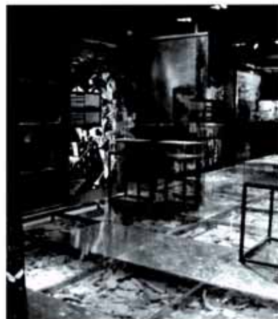
Museu de la Pau de Gernika.