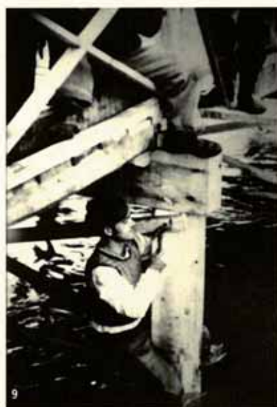
8. Trinxera de l'exèrcit republicà. 1938.