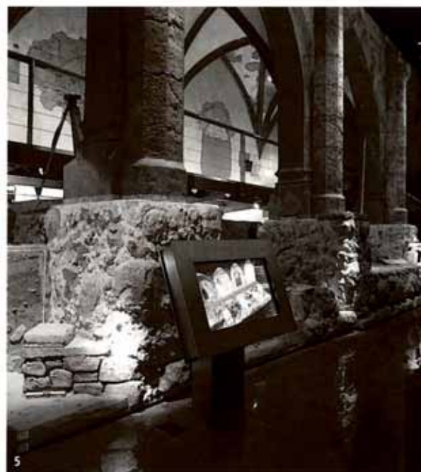
5. Espai dedicat a l'arqueologia urbana.

Arqueològica d'Alacant i, gràcies a les tecnologies de la comunicació, es constituirà en una finestra oberta a la xarxa dels museus, ja siguin locals o internacionals, i al públic en general. Un museu compromès amb el desenvolupament d'un discurs unitari i vertebrador del nostre passat històric i cultural valencià; divulgador de la riquesa i diversitat dels nostres museus i patrimoni arqueològic, que clarament aposta per ser una infraestructura estable de qualitat, al servei del turisme cultural i alternatiu.