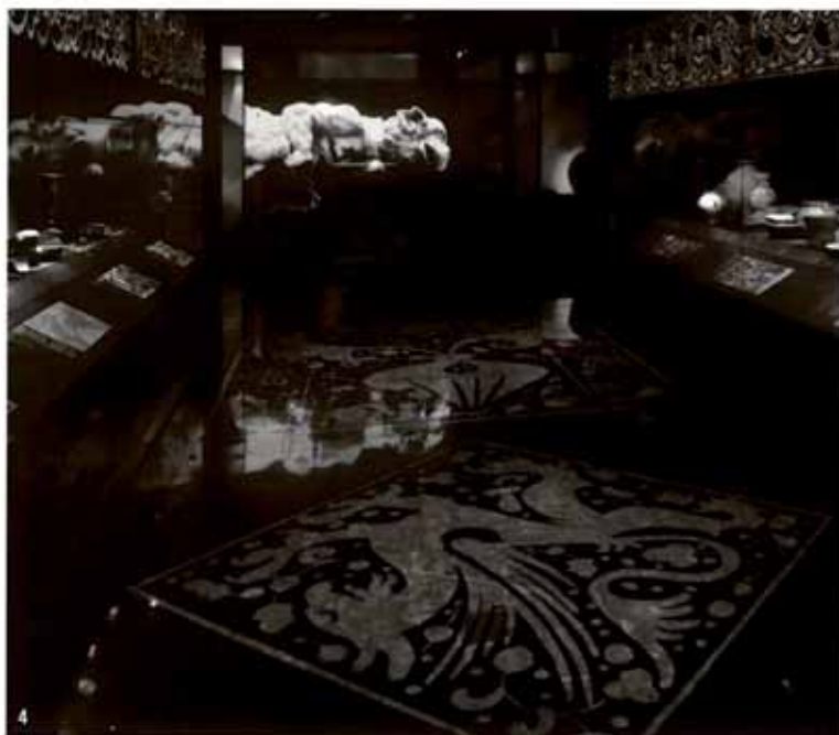
4. Sala dedicada a l'Edat Mitja.