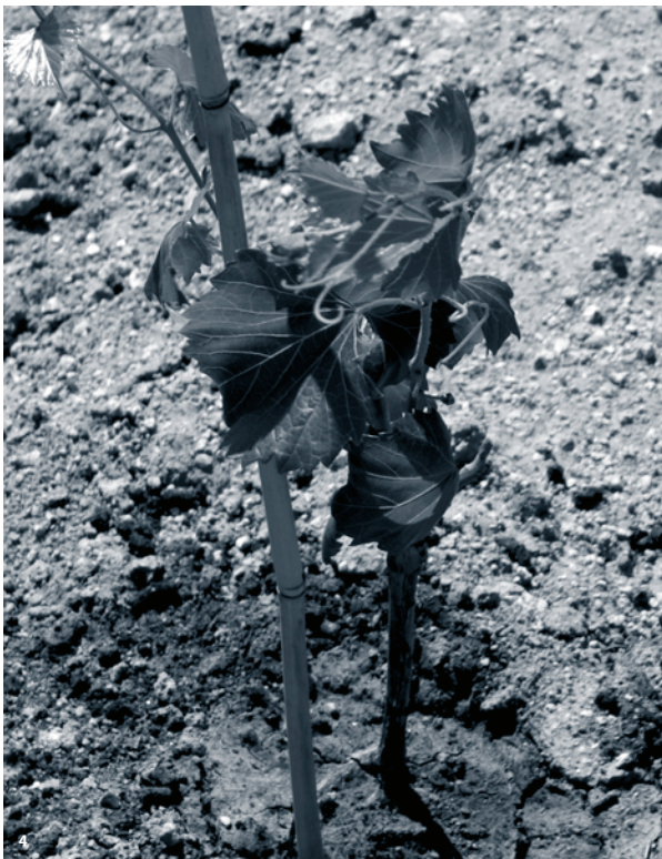
4. La Vinya Romana Experimental en fase de creixement. Fotografia: Leticia Sierra Díaz 2009.