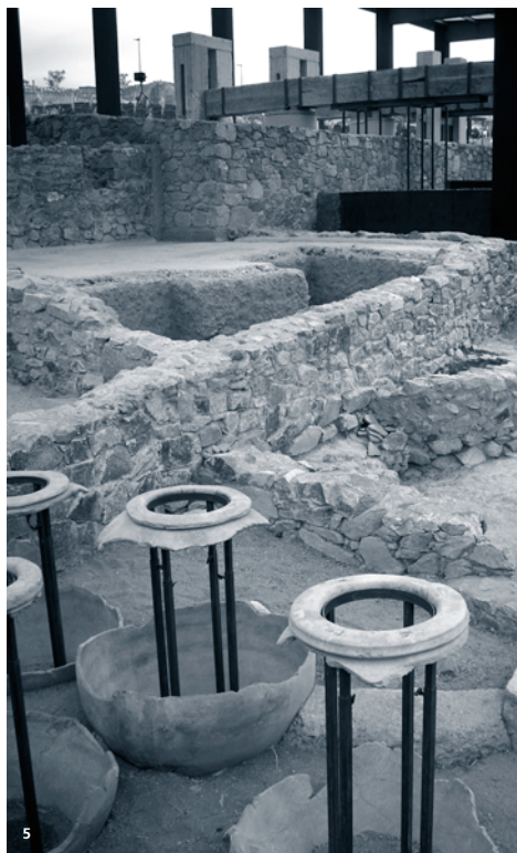
5. Vista dels dolia originals conservats in situ i dels diferents àmbits restaurats.