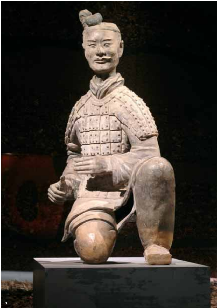
7. Detall de l'exposició «Els Guerres de Xi'an».