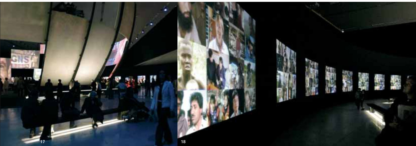
17 i 18. «Veus».