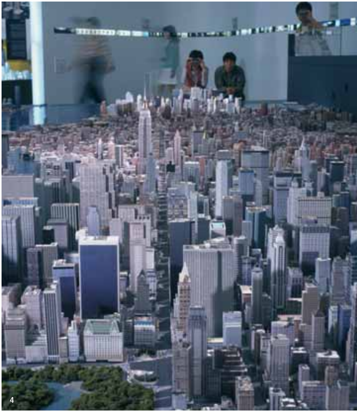
4. Maqueta de la ciutat de Noya York, a l'exposició «Ciutats-Cantonades».

Paral·lelament, l'exposició volia reflexionar sobre les condicions de llibertat individual i col·lectiva que estan a la base del diàleg necessari entre les diferents cultures.