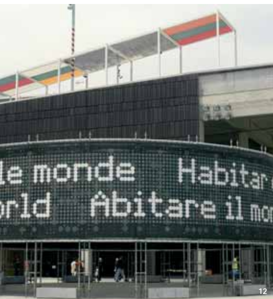
12. «Habitat el món».