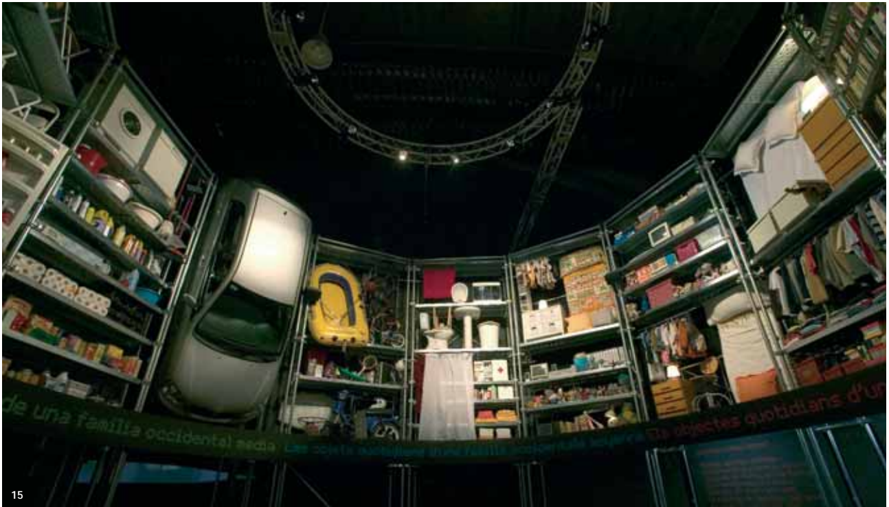
15. «Habitat el món».