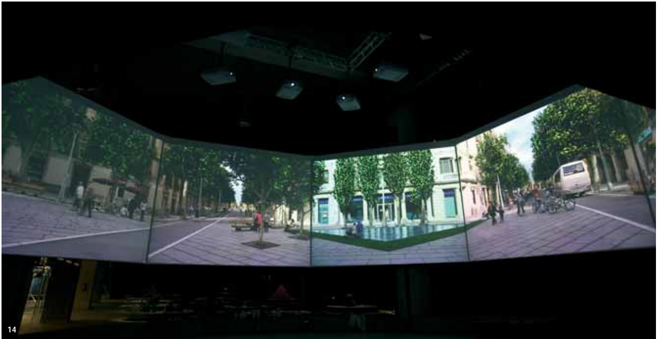
14. «Habitat el món».