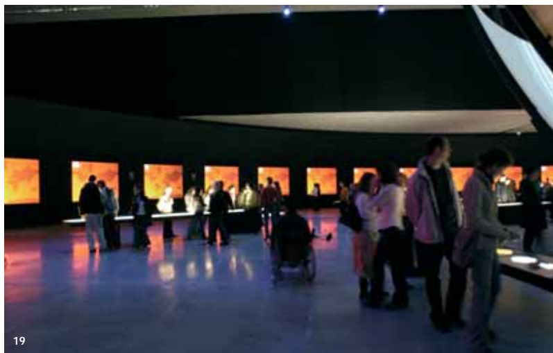
19. «Veus».

Comentari: el més important d'aquest museu no és veure aquesta exposició, sinó poder visitar aquest nou centre. La Caixa, després de molts anys d'una política cultural erràtica i amb accions efímeres, ens ha retornat els recursos i la inversió (via obra social-fundació) que els ciutadans de Catalunya es mereixen, amb dos equipaments singulars: Caixa Fòrum i el Museu de la Ciència. Ho celebrem!