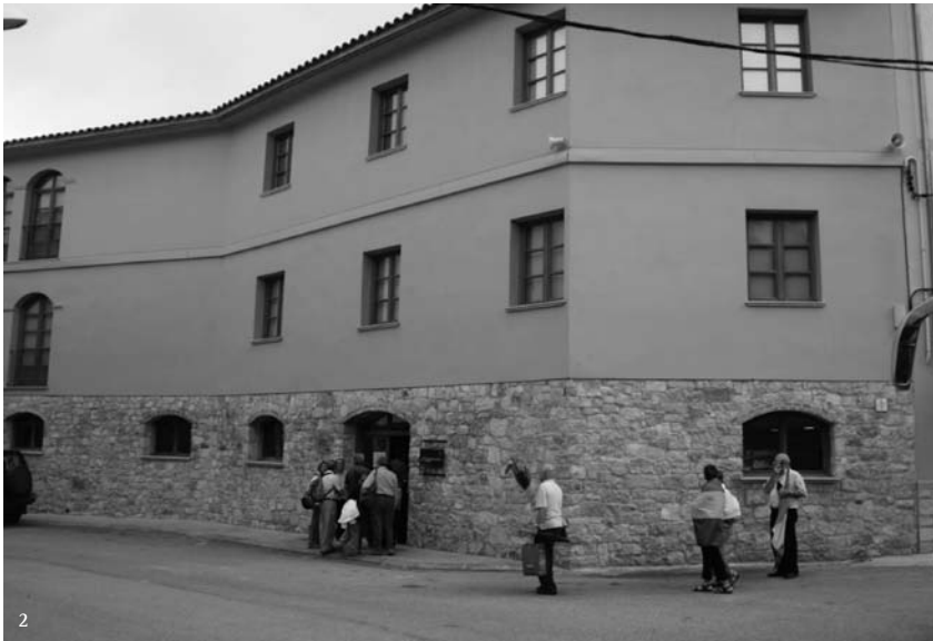
2. Façana del Centre d'Interpretació "Internacionals a l'Ebre", a La Fatarella, en el marc dels espais dedicats a la Batalla de l'Ebre. Ha estat inaugurat el març de 2010, però el mes de desembre va haver de tancar les portes.