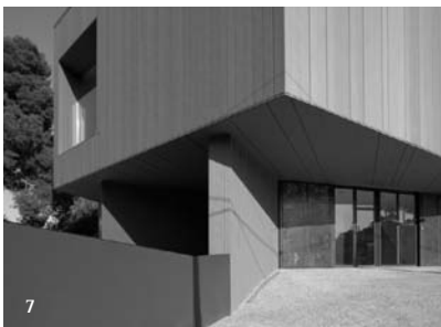
6. Interior del nou museu monogràfic del jaciment ibèric de Ca n'Oliver, (Cerdanyola), inaugurat l'1 d'octubre de 2010.