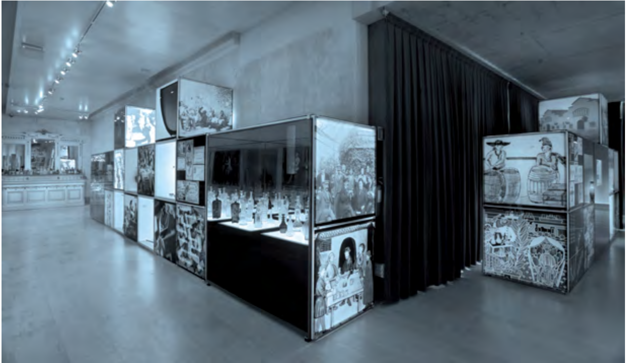
VINSEUM, premiat pel seu innovador projecte de reforma.

evidencien que en els dos darrers anys l'accent en els museus s'ha posat principalment en els projectes i els programes de difusió, més que en les grans intervencions arquitectòniques o constructives. Continuen fent evident, però, la voluntat de mantenir un bon nivell d'exigència i, malgrat la crisi i la manca de recursos, l'empenta del sector per mantenir l'activitat de qualitat.