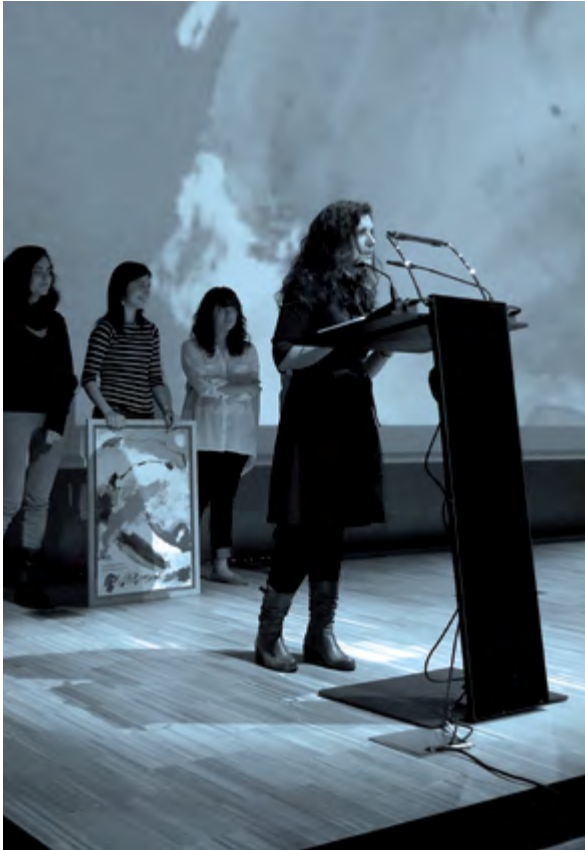
La directora de la Biblioteca Museu Víctor Balaguer de Vilanova recollint el premi al Projecte Viquipèdia .

tres viquipedistes residents estables que treballaven simultàniament i amb el suport de la comunitat viquipedista, imatges i dades; actualment, el fons del Museu Víctor Balaguer es pot consultar en més de vint llengües. El resultat ha estat un increment notable del nombre de visualitzacions de continguts a Viquipèdia i de la qualitat dels continguts incorporats, tant textuais com iconogràfics. Alhora, ha resultat un cas d'estudi dins la comunitat viquipedista i ha posicionat la institució en el panorama dels entorns digitals.